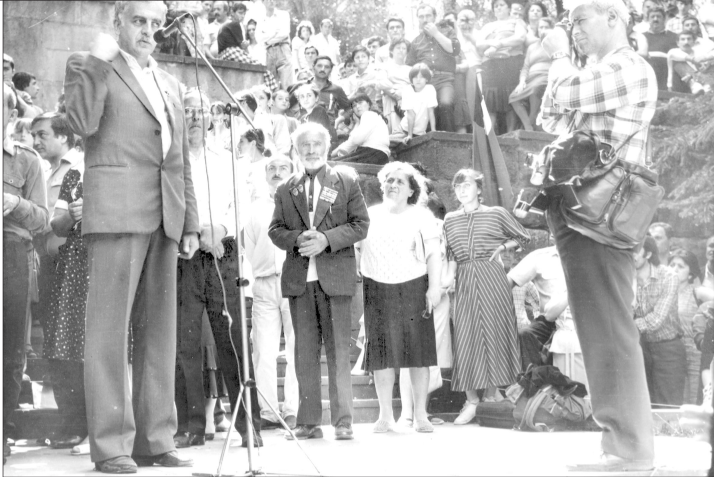
ზვიად გამსახურდია ბორჯომში. გასული საუკუნის 90-იანი წლები.