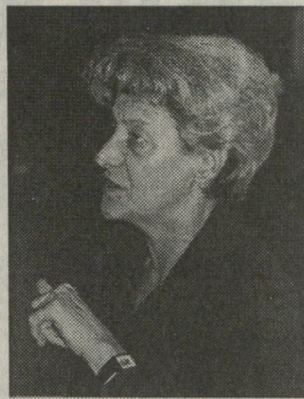
ეს, მაგრამ მან სამი თვე მინც იცოცხლა თავისუფლებაში. მისი „პატიროვია“ ძალიან ძნელი იყო, რადგან „ზვიადისტი“ იყო და ჩიჭოვანის ჭურის აუფთქებაში და ყვარლის ტყის ამბებში ეღებოდა ბრალი.

- „პატიროვია“ დიდი ფული ღირს, ასე ამბობენ.