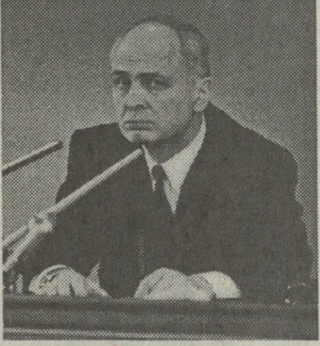
ამ დროს დაეპატრონებინა ადვილად და მართავენ ქვეყანას ამიტომ ბევრი ვინმე ხმას ვერ იღებს კორუფციასთან ბრძოლისათვის მსოფლიმხედველობა უნდა გამოვიცვალოთ. ამ იდეოლოგიით კორუფციას კი ვერ მივსვამთ, კორუფცია მოვსვამთ.

მე რომ არაფერი არ ვიპარებ და დიდიან დღემდე თავი ძლიერ გამაქვს და არაფერი გამაჩნია, ეს სრულიად არ არის საამაყო. მაგრამ საერთოდ სისტემა არ არის მოწყობილი. ეს კი სპეციალურად არის გაკეთებული. ჩვენ რომ გულუბრყვილოდ მივინდეთ ვიღაც კეთილ მჩრეველებს, სწორედ ისინი ფიქრობენ იმაზე, რომ კორუმპირებულ ქვეყანას უფრო ადვილად ჩაიგდებენ ხელში და ნებისმიერ დროს ყურში მიკიდებენ ხელს სწორედ