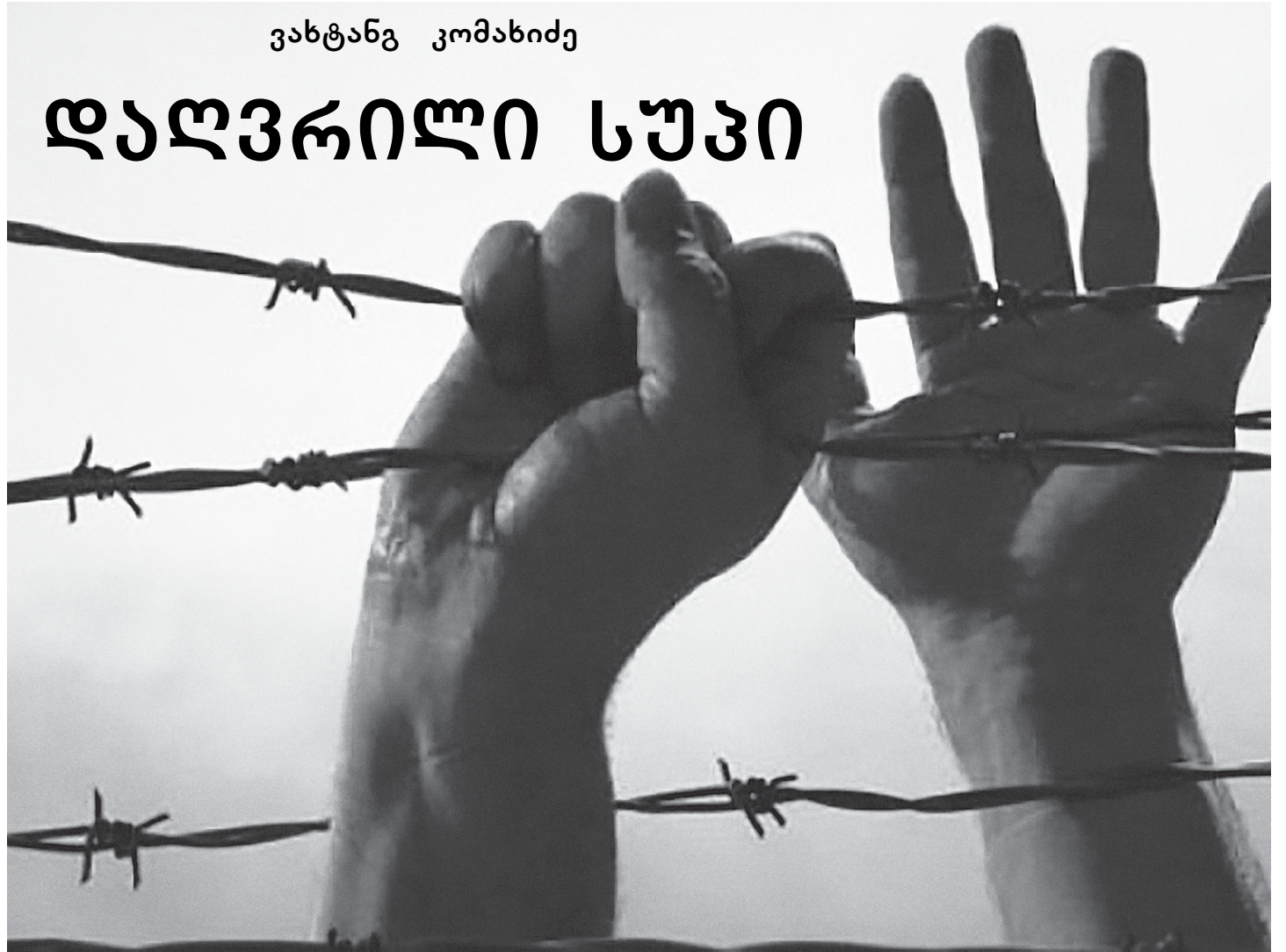
დასაწყისი პირველ გვერდზე

მარიამ, მარიამ, მარიამ. მარიამ? — მარიამ. მარიამ, მარიამ — მარიამ, მარიამ.