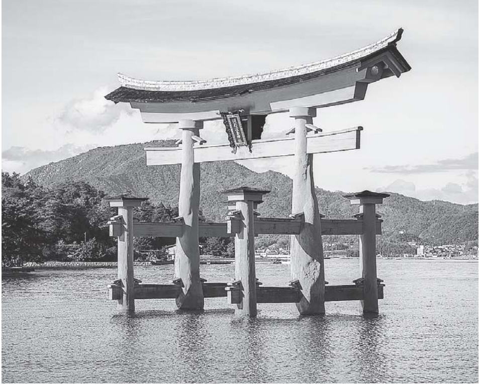
ჰო, ამ აზიელ მკაცრებს ეშმაკობას ვერ დაუნუნებდი.

პრევერი დადუმდა. ტანაკავას მართლაც უზადოდ მოეფიქრებინა ყველაფერი.