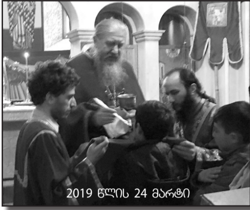
2019 წლის 24 მარტი