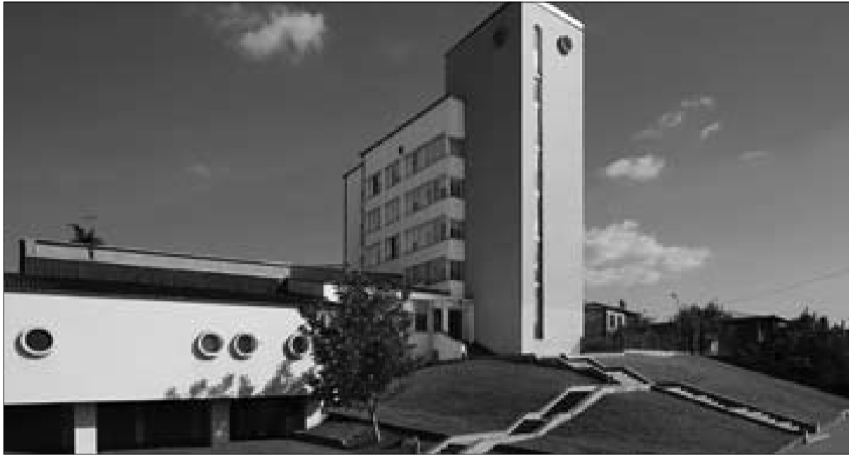
ქუთაისის საქალაქო სასამართლო