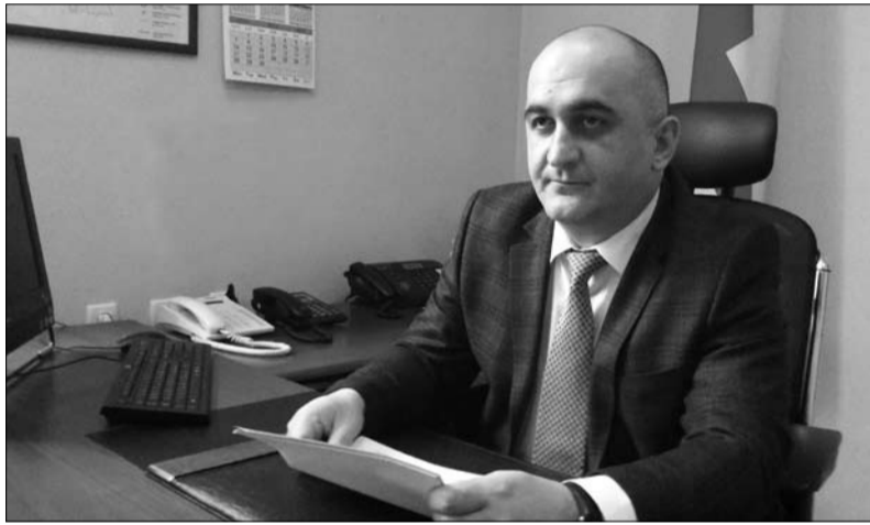
თავი გოგონია, ქუთაისის საქალაქო სასამართლოს თავმჯდომარე

რაც შეეხება მოქალაქეების სახლიდან გაუსვლელად სარჩელის შემოტანას, ამ ინოვაციურ საკითხთან დაკავშირებით ვიცი, რომ მიმდინარეობს მუშაობა.