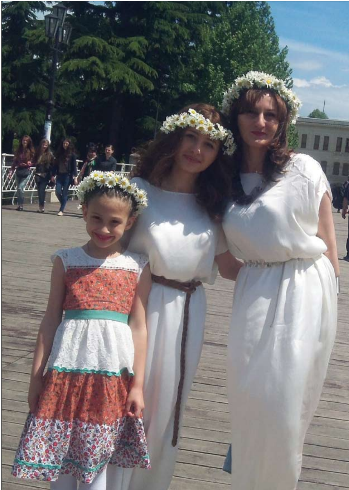
გაგრძელება მე-8 გვერდზე

„არაკრძალებული, სეპარანის და სვლილუბაგით გაემორჩეული“ — როგორ აფასებენ ქუთაისის საკრებულოს 4 წლიან მუშაობას