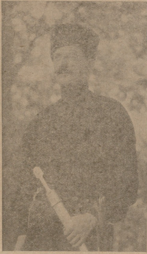
საქართველოს ერთეული გმირი მ. ი. ბ. ს. კ. რ. ლ. ა. შ. ვ. ი. ლ. ი. მისი გარდაცვალების წლისთავზე

მეფობს ხიდავების მძიმეობით ადამიანის სული ვერტიკალურად შექმნილ უსაბუნებრობას და ეს დიდი ბრძოლები ევროპის განვითარება კომპლექსის მძიმეობის სახით. კომპლექსი და მძიმეობა მსხველდ და გოლფს უკანასკნელთა გეგმა მის ურთიერთ იდეებს ანაცვალა. რამდენადაც მართებული და ლეგიტიმური იყო კომპლექსის აღმშენებელი მემკვიდრეობის კაპიტალიზმის სისტემის მიმართ, იმდენადვე გასაზრებელი შეიქმნა მისი ურთიერთ იდეების გადარჩენა ცხოვრების სინამდვილეში. კომპლექსი ძველს ადვილად შეეძობოდა, და ახალი ვერ შეეძლო. ვერ შეეძლო, რათა ყოველ მის დეველმას, კაპიტალიზმის მიმართ დაუკრებელი, იდეალობით დაედა და-საბამი, ადგილი რეალურ სინამდვილეს, ის უფრო ხერ-