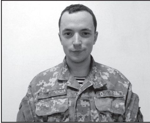
ლოგიების სპეციალისტები, რომლებიც ჯერ არ გაქცეულან საქართველოში ან გერმანიაში?

უკრაინაში აგრესიის რუსეთის შეტევები გრძელდება. ფართომასშტაბიანი იერიშის (რომელსაც დამპყრობლისგან მოვლად) შედეგად უკრაინის შეიარაღებული ძალების კაპიტანი, საზოგადო მოღვაწე ვიქტორ ტრეგუბოვი აღნიშნავს, რომ რუსეთის რუსეთის ისეთი უსაზღვრო არაა, როგორც წარმოაჩენენ. მათ შორის, ადამიანური ძალების მხრივ, ის ასევე ყურადღებას ამახვილებს იმ სასაზღვრო და სამართლებრივ ქაოსზე, რომელიც რუსეთში საკუთარ თავს შეუქმნა უკრაინის ტერიტორიების მიტაცებით. ვიქტორ ტრეგუბოვი უკრაინულ მედიას ესაუბრა.