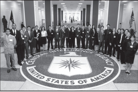
მიამზადა კახა ხატიაშვილი

ყველაზე გააფთრებული ბრძოლები კვლავაც დონბასშია.