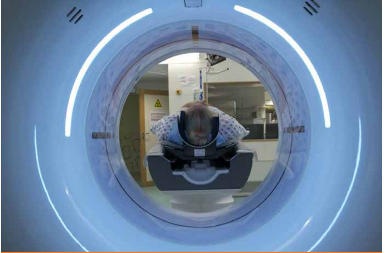
სახელმწიფო აუდიტის სამსახური დაავადებების პრევენციის მიზნით განხორციელებული ღონისძიებებით დაინტერესდა

ახლა ვნახოთ, რა ხარვეზები გამოავლინეს სახელმწიფო აუდიტორებმა. ცნობიერების ამაღლების მიზანია, უზრუნველყოს სამიზნე მოსახლეობის დიდი