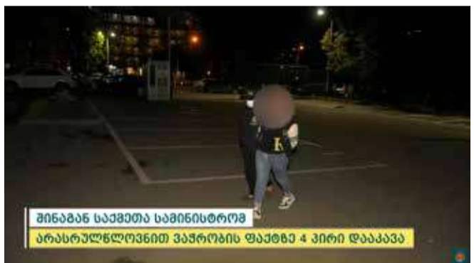
შინაგან საქმეთა სამინისტრომ არასრულწლოვნით ვაჭრობის ფაქტზე 4 პირი დააკავეს

შინაგან საქმეთა სამინისტროს ცენტრალური კრიმინალური პოლიციის დეპარტამენტის ორგანიზებულ დანაშაულთან ბრძოლის მთავარი სამმართველოს ტრეფიკინგისა და უკანონო მიგრაციის წინააღმდეგ ბრძოლის სამმართველოს თანამშრომლებმა, გენერალურ პროკურატურასთან ერთად საქმეზე ჩატარებული ოპერატიული და საგამოძიებო მოქმედებების შედეგად, ოთხი პირი დააკავეს.