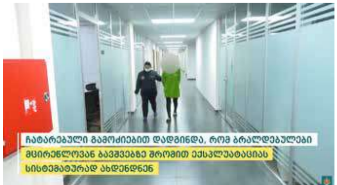
ჩატარებული გამოძიებით დადგინდა, რომ ბრალდებულები მცირეწლოვან ბავშვებზე შრომით ექსპლუატაციას სისტემატიურად ახდენდნენ

ორ პირს ბრალდება საქართველოს სისხლის სამართლის კოდექსის 143 სექუნდა მუხლის მეორე ნაწილის „ბ“ და მესამე ნაწილის „გ“, „ე“, „ვ“ ქვეპუნქტებით წარედგინათ, რაც სასჯელის სახით 14-დან 17 წლამდე თავისუფლების აღკვეთას ითვალისწინებს, ხოლო ორს ბრალდება 143 სექუნდა-ე მუხლის მეორე ნაწილის „ბ“ ქვეპუნქტით წარედგინათ, რაც სასჯელის სახით 11-დან 15 წლამდე თავისუფლების აღკვეთას ითვალისწინებს.