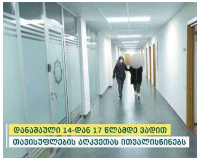
დანაშაული 14-დან 17 წლამდე ვადით თავისუფლების აღკვეთას ითვალისწინებს

საქართველოს შინაგან საქმეთა სამინისტროში ჩატარებული გამოძიებით დადგინდა, რომ ოთხივე ბრალდებული, სარგებლის მიღების მიზნით, მათ არასრულწლოვან ოჯახის წევრებს შრომით ექსპლუატაციას უწევდნენ. ბრალდებულები მუქარითა და ფსიქოლოგიური ზეწოლით, ოთხ მცირეწლოვან ბავშვს აიძულებდნენ თბილისის ქუჩებში მოწყალეების მოთხოვნას და სხვადასხვა წვრილმანი ნივთების გაყიდვას, აღნიშნულის შედეგად შეგროვილ თანხას კი თავისი შეხედულებისამებრ განკარგავდნენ.