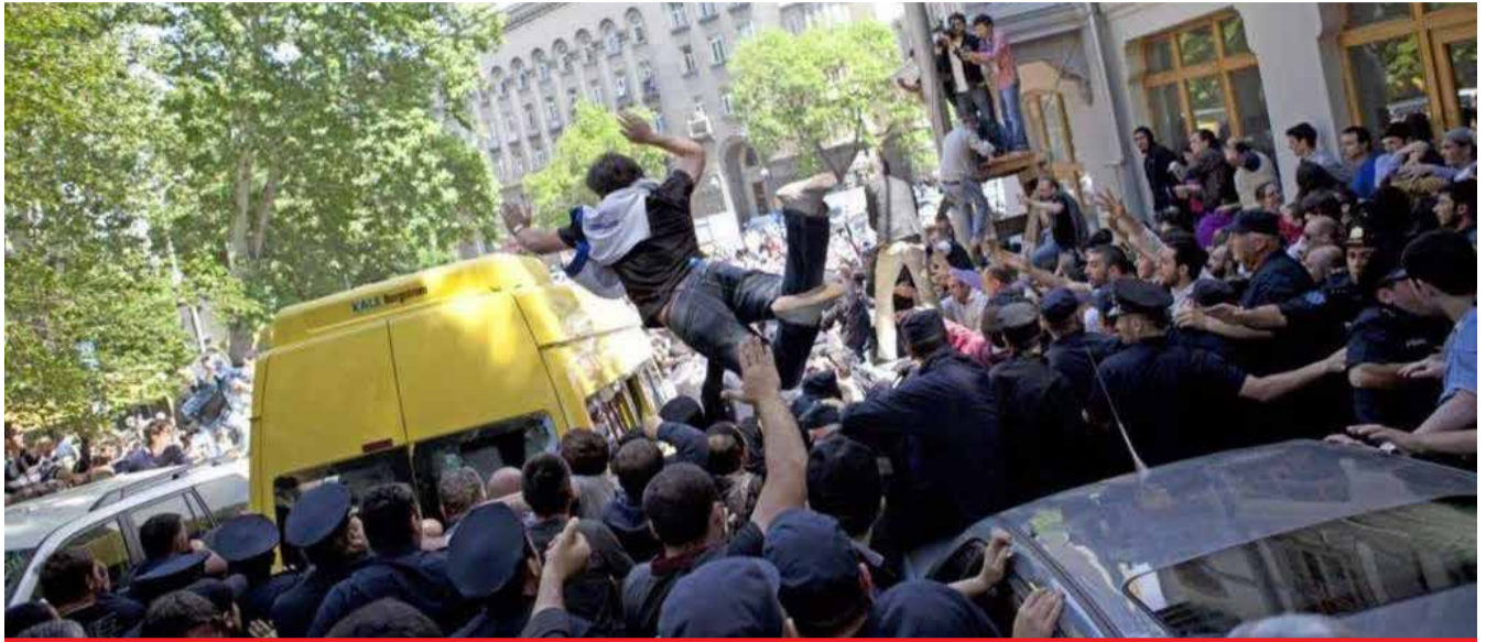
რა მოხდა თბილისში 2013 წლის 17 მაისს – სპეცსამსახურის თანამშრომლის სკანდალური მონათხრობი

„პუტინი არც მალავს, რომ მისი მიზანია, რუსეთს საბჭოთა კავშირის კი არა, ცარიზმისდროინდელი დიდება დაუბრუნოს. ამიტომაც, ყველაფერზე მიდის. ამასთან, ვლადიმერ ვლადიმერის ძემ, რომელიც „კა გე ბე“-ს ტიპური პროდუქტია, კარგად იცის, რომ ბოლშევიკების ერთ-ერთი მთავარი შეცდომა მართლმადიდებლობის წინააღმდეგ გალაშქრება იყო. ყველაფერს თავი რომ დავანებოთ, იგივე მეორე მსოფლიო ომის დროს, რუსეთის