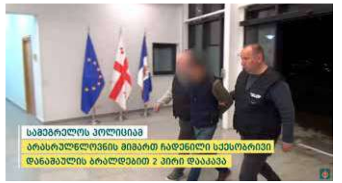
სამებრელოს პოლიციაში არასრულწლოვნის მიმართ ჩადენილი სქესობრივი დანაშაულის ბრალდებით 2 პირი დააკავეს

გამოძიება წინასწარი შეცნობით არასრულწლოვნის გაუპატიურებისა და წინასწარი შეცნობით ოჯახის არასრულწლოვანი წევრის გაუპატიურების ფაქტებზე, საქართველოს სისხლის სამართლის კოდექსის 137-ე მუხლის მე-4 ნაწილის „გ“ ქვეპუნქტით და 11 პრიმა 137-ე მუხლის მე-4 ნაწილის „გ“ ქვეპუნქტით მიმდინარეობს.