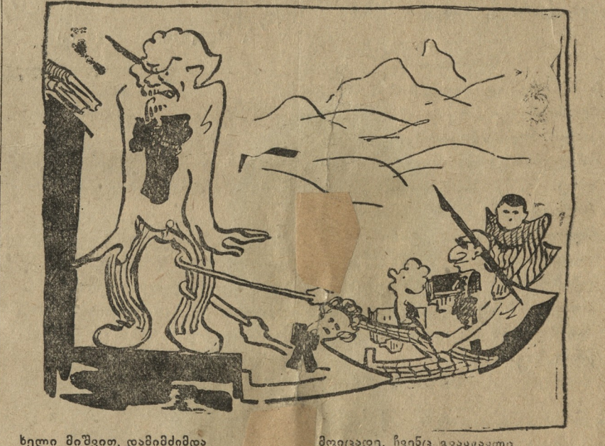
ხელი მიშვით, დამიმძიმდა თქვენი თრევით ფეხი ძლიერ.