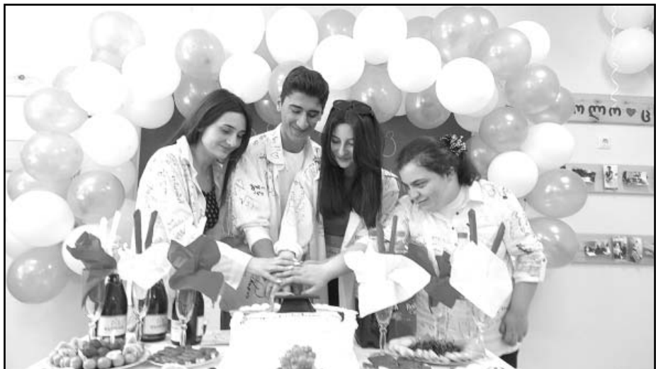
რუფოთის საჯარო სკოლა