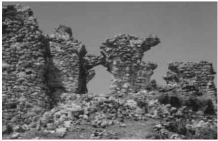
„არს მთის კალთას, სკანდას, სასახლე მეფეთა და ციხე დიდი, დიდშენი“ პანსუშტი ბაბრატონი