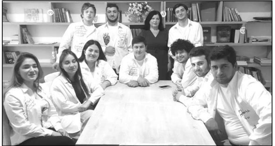
ბარდუბნის საჯარო სკოლა