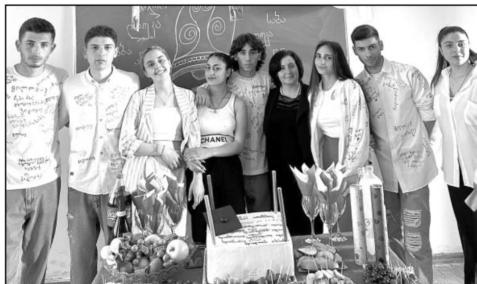
ენრის საჯარო სკოლა