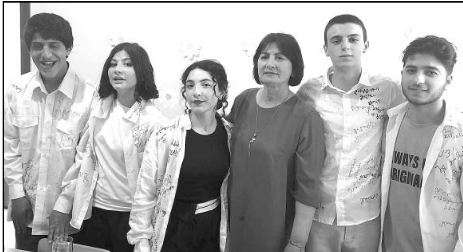
გოგნის საჯარო სკოლა