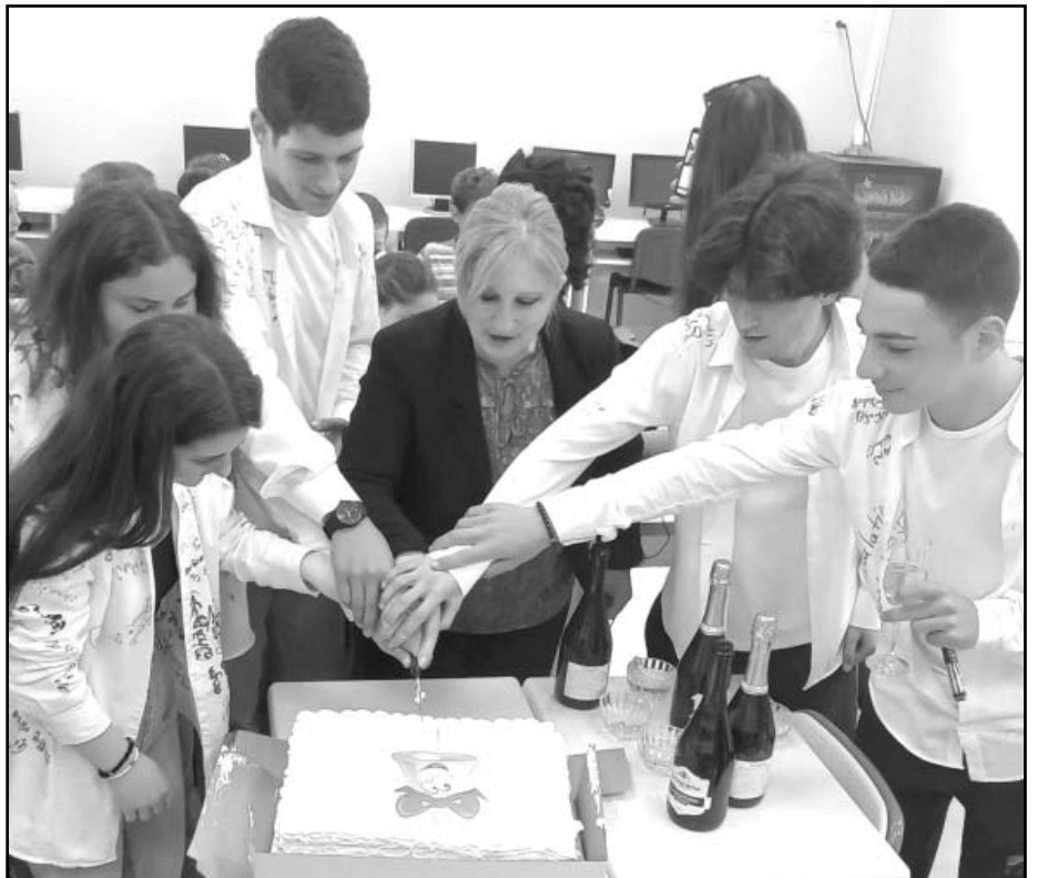
ჩხარის №2 საჯარო სკოლა