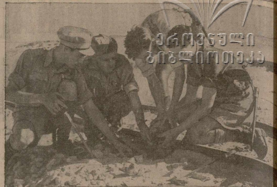
Английские саперы вытаскивают мину, заложенную немцами под рельсами железнодорожной линии в Ливии. Каждый фут пути был проверен до того, как было возобновлено движение поездов.

ЛОНДОН (ОНА). — 10 декабря, американский Государственный секретарь Корделл Холл заявил, что «восстановление свободной Албании» вытекает, как нечто само собой разумеющееся из Атлантической Хартии. В Лондоне полагают, что греческое правительство в изгнании выступит на днях с официальным заявлением по вопросу об албанской независимости. В этом заявлении будет также затронут вопрос о судьбе греческого населения в южной Албании. Весной 1939 года, как известно, Италия аннексировала Албанию.