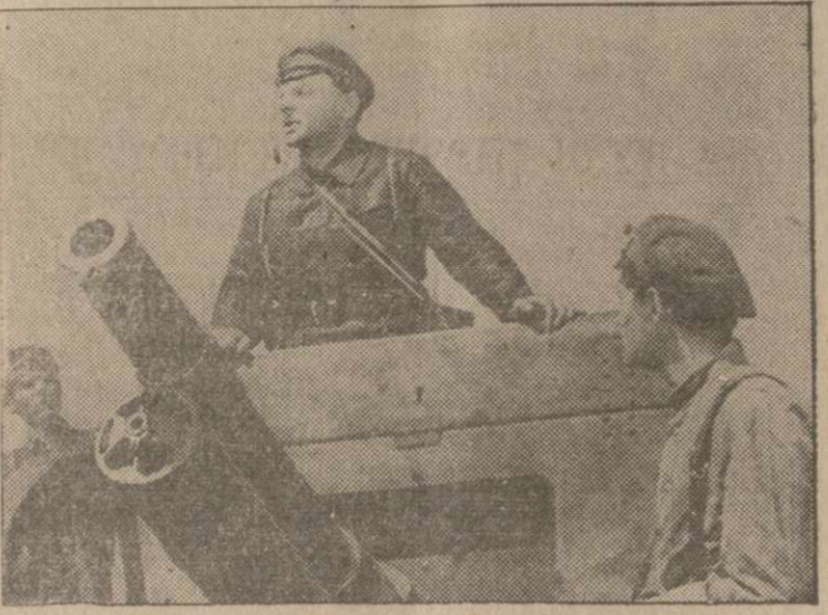
A SCENE FROM "FORTRESS ON THE VOLGA", latest Soviet film importation, which will have its American premiere at the Stanley Theatre, on Wednesday morning, December 23rd.

If that last run was just one too many on that old pair of silk or nylon rose, don't let it get you down. Those worn-out stockings you've got lying around in your closets can have a new lease on life when converted by the U. S. Army into powder bags for ammunition. Just dig them out and leave them at your nearest hosiery or department store.