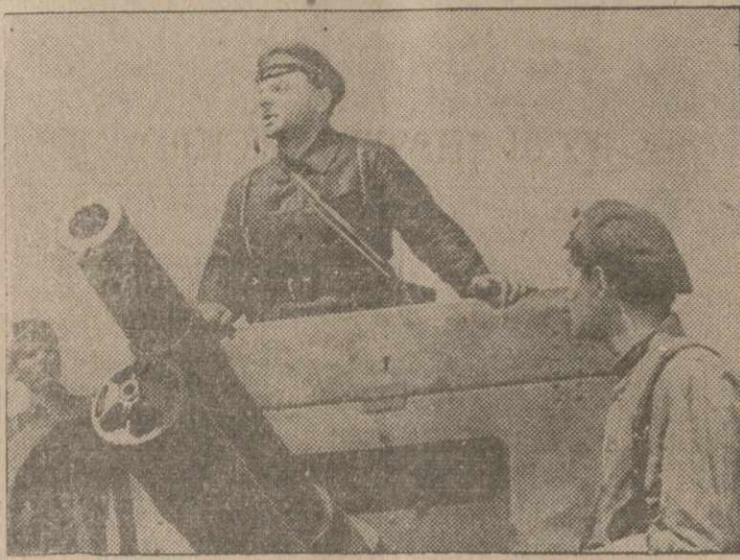
A SCENE FROM "FORTRESS ON THE VOLGA", latest Soviet film importation, which will have its American premiere at the Stanley Theatre, on Wednesday morning, December 23rd.

If that last run was just one too many on that old pair of silk or nylon rose, don't let it get you down. Those worn-out stockings you've got lying around in your closets can have a new lease on life when converted by the U. S. Army into powder bags for ammunition. Just dig them out and leave them at your nearest hosiery or department store.