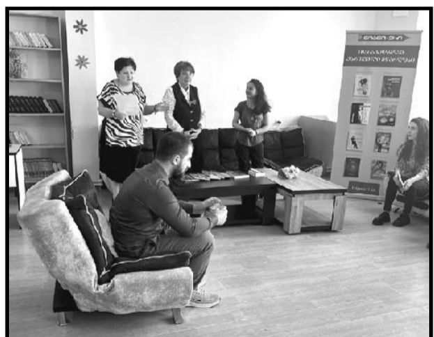
კასპის მუნიციპალიტეტის ბიბლიოთეკისა და მუზეუმების გაერთიანება.