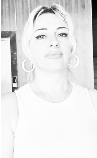
ვრი მუშაობა საჭირო.

ბათუმში თერთმეტდღიან აღდგენით სასწავლო-საწვრთნელ შეკრებაზე იმყოფებოდნენ ტანვარჯიშეები ქუთაისიდან და თბილისიდან. მათთან ერთად შეკრება ბათუმელმა სპორტსმენებმაც გაიარეს