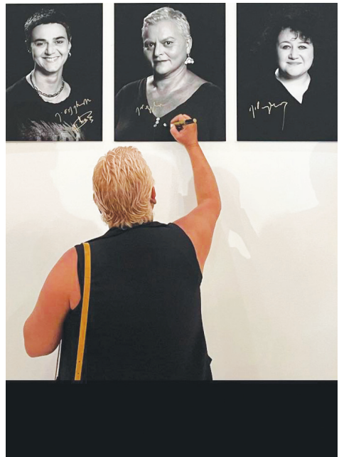
სურათს და იმედი მაქვს, საინტერესო როლებს შემომთავაზებენ, - თქვა „აჭარასთან“ სა-