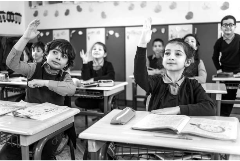
(დასაწყისი „ს.პ“ N9)