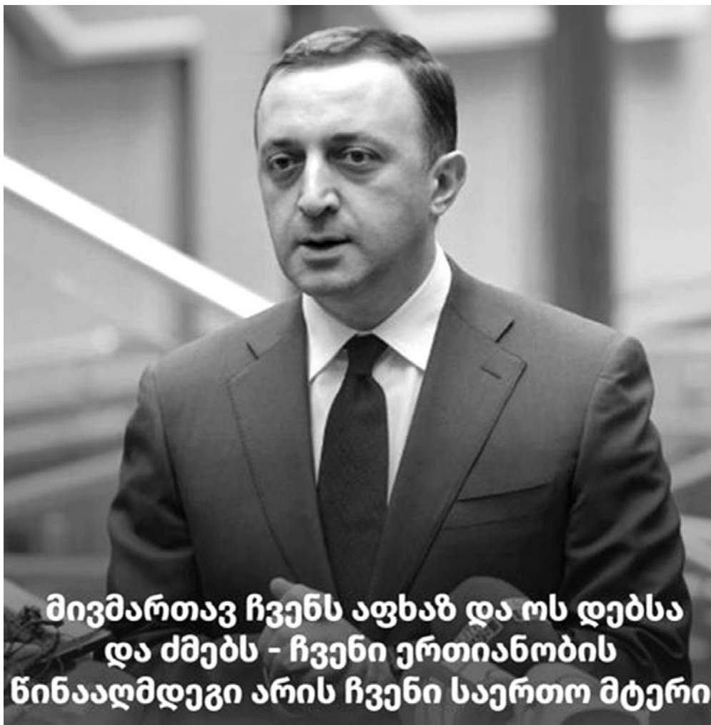
მივმართავ ჩვენს აფხაზ და ოს დებსა და ძმებს - ჩვენი ერთიანობის წინააღმდეგი არის ჩვენი საერთო მტერი

ხალხს არსებით ჰუმანიტარულ დახმარებას უწევს ომის დაწყების დღიდან. ეს ხდება ქვეყნის და ინდივიდების დონეზე, რომლებიც ამჟამად ცხოვრობენ საქართველოში. ქართულმა სკოლებმა 2200-ზე მეტი უკრაინელი მოსწავლე მიიღო და უკრაინულ ენაზე უზრუნველყოფენ სწავლებას ოფიციალური, უკრაინული სასწავლო პროგრამით.