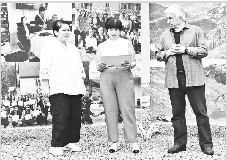
ი. ბე-7 გვ.

რჩევია. ამ ხეობის ისტორიული მნიშვნელობის გარდა, აღსანიშნავია მისი ლინგვოლოგიური და ეთნოგრაფიული თავისებურებები, კერძოდ, ის ფაქტი, რომ აქ ერთმანეთის გვერდით ცხოვრობენ ქრისტიანული და მამულიანური აღმსარებლობის ადამიანები, რომელთა თანაცხოვრების საფუძველზე კულტურათა ერთგვარი სიმბიოზია წარმოქმნილი. პროექტის ფარგლებში მოპოვებულია მასალა ჩვენს ყველა მსოფლიოსს გადააჭარბა. მისმა ანალიზმა