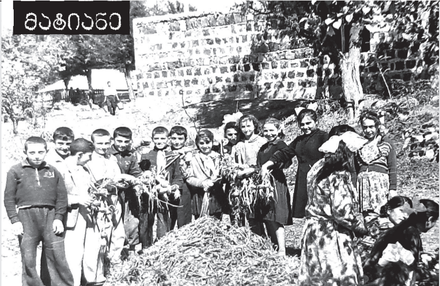
ასპინძის საშუალო სკოლის მოსწავლეები. 1963 წელი