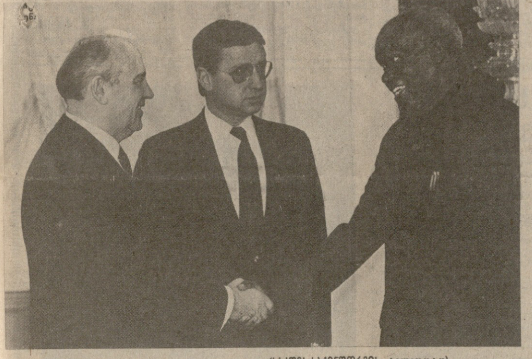
შეხვედრის დროს. (საქმის-საინფორმაციო ტელეფონი).