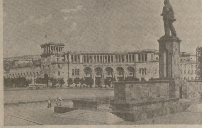
ერევანში, ვ. ი. ლენინის ხატულობის მშენებლობა.

სომხეთში განხორციელდა მასშტაბური მშენებლობის სამუშაოები. ეს განხორციელდა კომუნისტური პარტიის მიერ დაიწყო განახლების სამუშაოები. ეს განხორციელდა კომუნისტური პარტიის მიერ დაიწყო განახლების სამუშაოები.