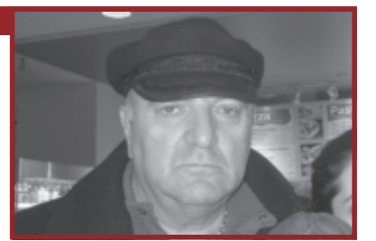
შტრიხი ბიჭი ბაბინას ახალიონიან