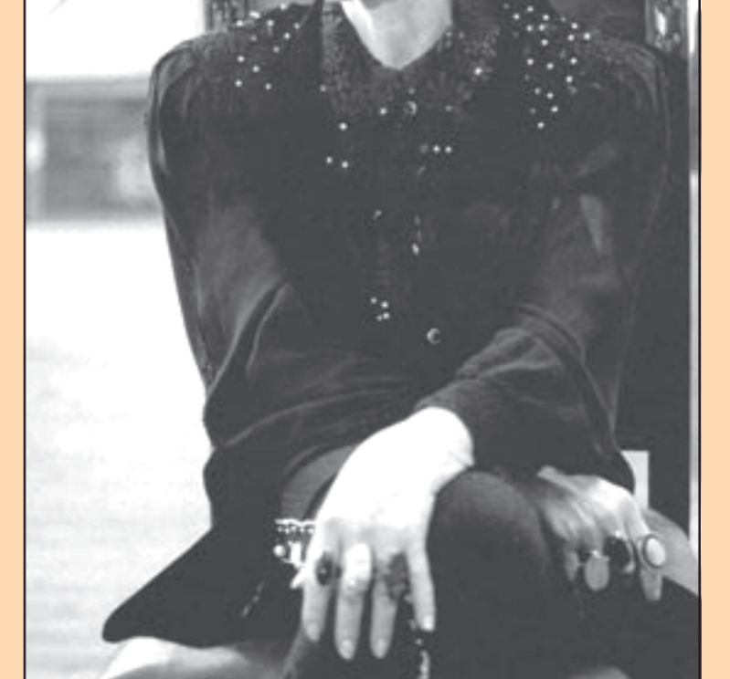
„სიზმრები საქართველოზე“ (ამონარიდი წერილიდან) ალერსიანი, კეთილი სიტყვა უთქვამთ, და არა მხოლოდ ჩემთვის, სხვებისთვისაც, რაც უფრო მნიშვნელოვანია. ო დმერთო, - ვწერ მე, - შენ დათვარე რედაქციის ეს კუთხე და ყველაფერი, რასაც გნებავთ, დღე ვიცი, და ისიც, რის ვაგებაც არ გვიოწყობა. არასოდეს მისცემოდეს დავიწყებას სახელები, ეს ლექსები რომ ეძღვნება.“

იმ საღამოს ულამაზესი ლექსების ამწვინდა თუ შემთხზველად რიგში ვისხებილი, საპატიო ადგილებზე თუქცა ბელა ვერ ვგვხვდებოდა. თვალისხიმი უკვე წართმეული ჰქონდა... კითხულობდა თავისი განუმეორებელი ხმით თავისივე საოცარი ლექსებს, ხანდახან თუ ჩაენინებოდა ხელოვნების რომელიმე გამოჩენილი მოღვაწე მასსაღმებელი სიტყვით.