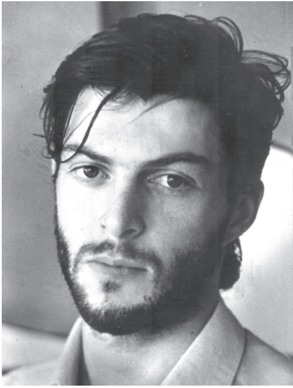
ის მუდამ ახალგაზრდად და მუდამ ულამაზეს, ელეგანტურ მამაკაცად დარჩება, მას არასოდეს შეეგერცხება თმა, მით უმეტეს - არ გამელოტდება, არ დაუშნოვდება. მას ვერ გარყვნიან დრო, ვერ დაამბობს ჩვენს წარმოდგენებში. ის გმირია და გმირად დარჩება - რომანტიკულ გმირად, გმირად, რომელიც ამშვენებს ქვეყანას, კინოს და რომელმაც თავი გასწირა სამშობლოსთვის.