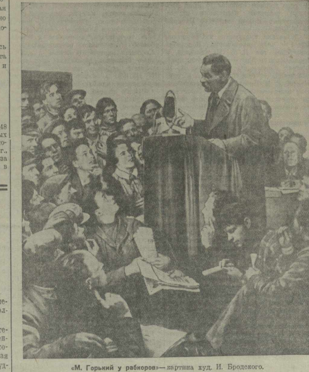
«М. Горький у рабкоров» — картина худ. И. Бродского.