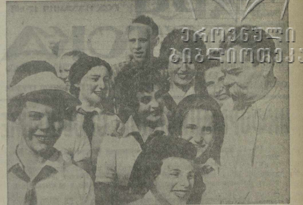
А. М. Горький среди пионеров на съезде советских писателей, 1934 г.