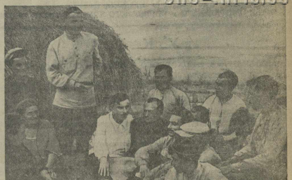
В колхозах Сагареджинского района развернута массово-разъяснительная работа вокруг реализации решений майского Пленума ЦК ВКП(б). На снимке: беседа в перерыве с колхозниками, работающими на уборке урожая в колхозе им. Жданова.

Завтра и послезавтра на инструктивных совещаниях будет наглядно показано, как следует проводить обмер на местах.