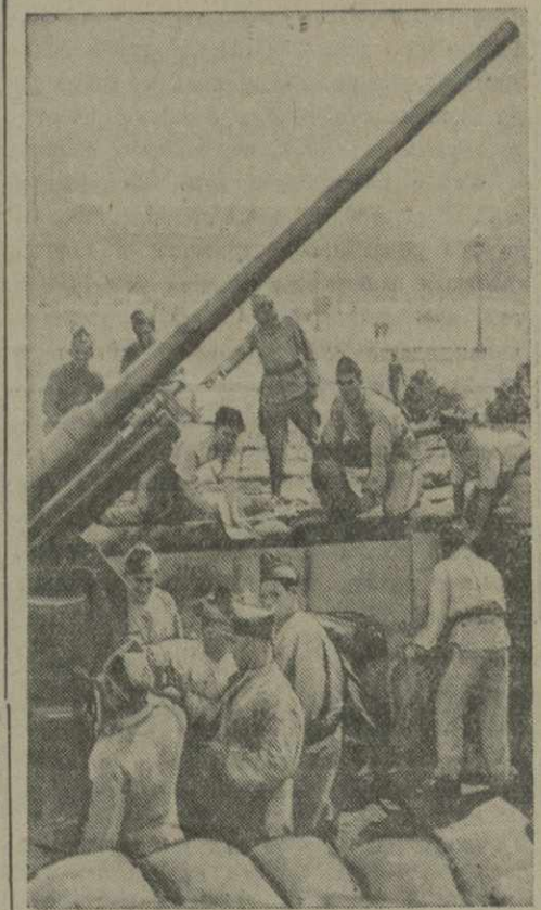
Подготовка и оборона во Франции. На снимке: демонстрация населению Парижа действия зенитной артиллерии.

ПАРИЖ, 26. (ТАСС). По сообщениям из Стамбула, многочисленные беженцы, прибывшие туда из Албании, единодушно подтверждают, что в горных районах Албании происходит партизанская война. Албанские партизаны непрерывно нападают на итальянские войска. Отряды партизан состоят из албанских крестьян. В течение последних недель албанские партизаны убили более 800 итальянцев.