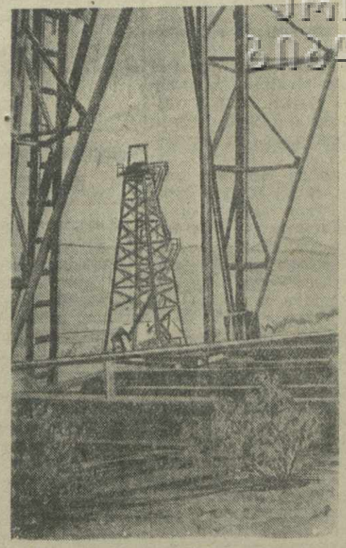
Вышки эксплуатируемых скважин Гruzнефти в Миpазани.

(От нашего специального корреспондента.)