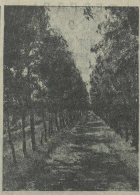
Закалптовья аллея в Потыоком питомнике Лиманстра.