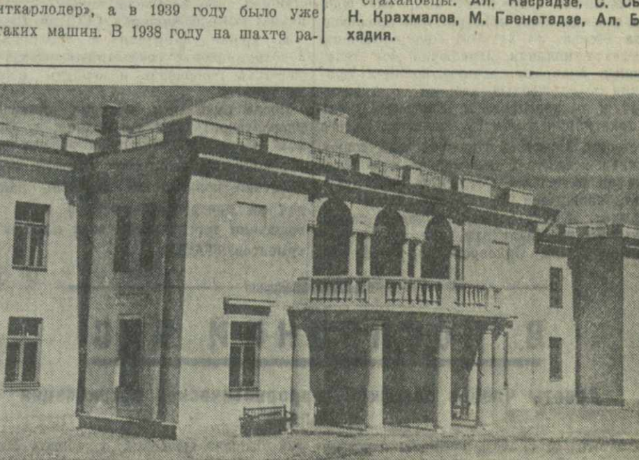
Здание поликлиники при шахте Центральной-Илдино имени СТАЛИНА (Донбасс).

СУХУМИ, (По телеф. от наш. корр.) В ряде сел Сухумского района по инициативе колхозников началось строительство шоссеных дорог. Колхозники артели «Цитли Свирн» Гумистинского сельсовета строят дорогу протяжением в 3,3 километра. Постройка этой дороги даст возможность колхозам «Цитли Свирн», «Дружба» и имени Налинина иметь постоянную связь с городом по сокращенному пути. Строительство дороги близится к концу, уже проведено около 2,3 километра.