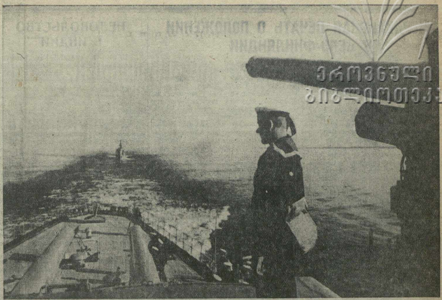
Краснознаменный Балтийский флот. На посту.

УРАЛЬСК, 7 (ТАСС). Колхозники Западно-Кавказской области проявляют в борьбе с засухой много инициативы и изобретательности.