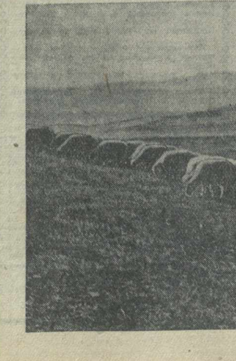
Отара колхоза им. Берия, Тбилисского района.