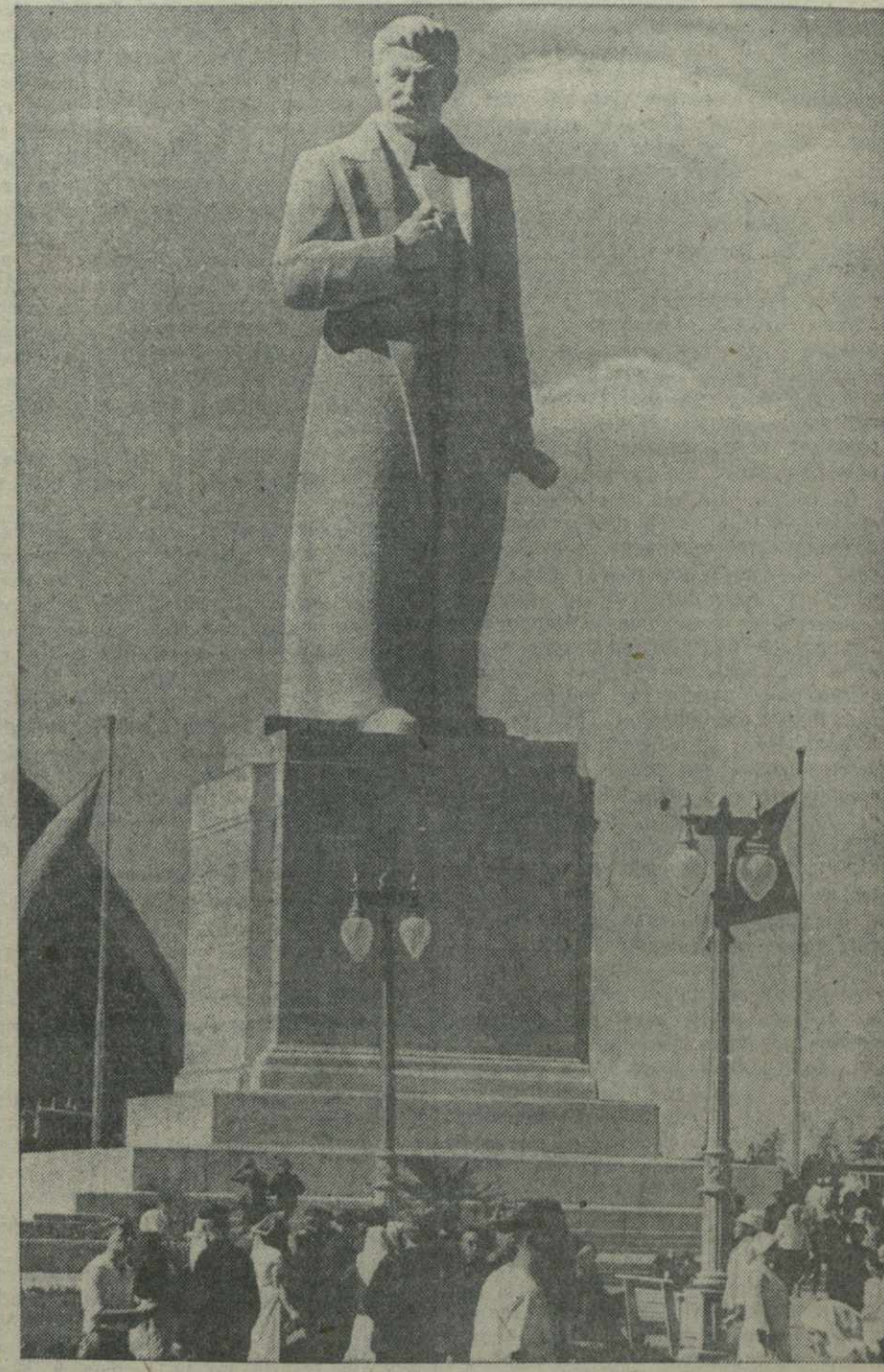
Монумент И. В. СТАЛИНА, установленный перед павильоном «Механизация» на Всесоюзной сельскохозяйственной выставке.

Академик Н. В. ЦИЦИН, директор Всесоюзной сельскохозяйственной выставки.