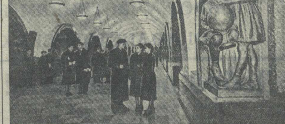
Сегодня исполняется 5-летие Московского метрополитена им. Л. М. Кагановича. На снимке: платформа станции метро «Площадь революции».