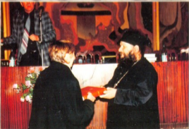
სამედიცინო ინსტიტუტი გაიშითა უონეუჩენისა თუმაზე - "ხელიგია და მედიცინა"

ერთ-ერთ ბრძოლაში საქართველოს ჯარის მხარეზე, თეთრ ცხენზე ამხედრებულ ჭაბუკს მიუღია მონაწილეობა, რომელსაც მონაწილადღევის სარდალი დაუმარცხებია და მეფეს მისთვის ჯილდოდ შავი ნაბაღი უბოძებია. ბრძოლის შემდეგ ჩვენს ჯარს უახლოეს ველესიამი გამარჯვების ჰარაკლისი ვადაუსდია. მეფესთან ერთად ტამარში გამარჯვების გმირც ყოფილა და როცა ღოცვა დამთავრებულა, მეფეს გმირი მოუკითხავს. ეუულა სახტად დარწმუნია, რადგან გმირი ვერ უნახავთ. მაშინ დემეტრის გაუნათებია მათი გონება და ერთხმად აღმოსდენით: - მადლობა უფალს! რადგან წმიდა გიორგის ფრესკაში ჭაბუკი მეომარი უხილავთ.