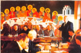
1998 წელს ჩატახიდა უაიროლოგიური ჰიპობლეტიზმისაგანი მიძღვნილი სემინარი