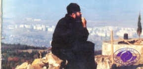
მონასტრის წინამძღვარი დამონანდრიუ მით

შავნაბაღობის ზეიმობენ ეოველი ოქტომბრის მერვე კვირის (ახ. სტ.).