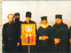
სტუმრები იქიუსალიმიდან შავნაბადს მონასტერში