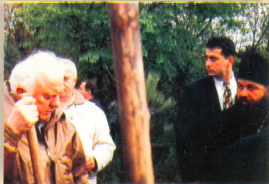
საქართველოს პრეზიდენტი ედუარდ-გოიბიჯი შავნაბადს მთის გამწვანებისას

2000-2001 წლის საბიუჯეტო, საშობაო და საღვთისმშობლის ეპისკოპოსის სხუდოდ საქართველოს ავტორიტეტის-პატივსაცემი, უწმიდესმა და უნეტაჲსმა ილია II-მ დანხა შავნაბადს მონასტერში