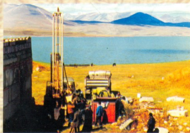
შავნაბადს მონასტრისა და მისი მხურის ძალებით 1999 წელს დასრულდა დიპლომატიის წმინდა ნინოს მამათა მონასტრის მშენებლობა

2000 წლის მოგონი, სანაჯიბიანის დიპლომატიის სტრატეგია სანაჯიბიანის ავტორიტეტის-პატივსაცემი მონასტრის მოწყობისას მსახიობი