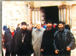
შავნაბადელები იქიუსალიმში, მაცხოვრის საფლავთან

2000 წლის მოგონი, სანაჯიბიანის დიპლომატიის სტრატეგია სანაჯიბიანის ავტორიტეტის-პატივსაცემი მონასტრის მოწყობისას მსახიობი