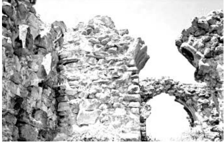
„არს მთის კალთას, სკანდას, სასახლე მეფეთა და ციხე დიდი, დიდშენი“ მასშტაბი პაბრატინი