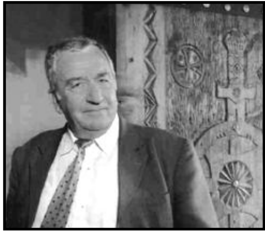
კასპის მუნიციპალიტეტის სახელოვნებო სკოლების გაერთიანება.