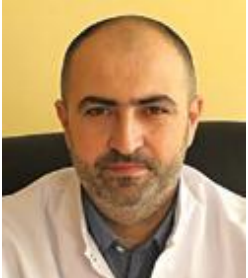
იკა „ლია გული...“ მოუხილოთ კარდიოლოგი... განთიადი...