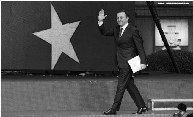
თბილისი. 15 დეკემბერი. 2023 წელი. კანდიდატის სტატუსის მინიჭებასთან დაკავშირებით გამართული საზეიმო ღონისძიება

მე მხვდა წილად პატივი, რომ ჩვენი ქვეყნის სახელითა და ჩვენი გუნდის სახელით ხელი მომწერა ჯერ ასოცირების შეთანხმებაზე, შემდეგ ჩემი მმართველობის პირველი პრემიერობის დროს ჩვენ წარმატებით დავასრულეთ უვიზო რეჟიმთან დაკავშირებული მოლაპარაკებები, შარშან უკვე მე მქონდა პატივი, რომ უკვე ოფიციალურად ჩვენი ქვეყნის სახელით შემეტანა განაცხადი ევროკავშირის წევრობაზე. შარშან მივიღეთ ევროპული პერსპექტივა, რითაც დამტკიცდა, რომ ჩვენი ქვეყანა გახდება ევროპული ოჯახის წევრი და დღეს უკვე 14 დეკემბერი ჩაინერება როგორც ისტორიული თარიღი. საქართველო დღეიდან არის ევროპული სახელმწიფო,