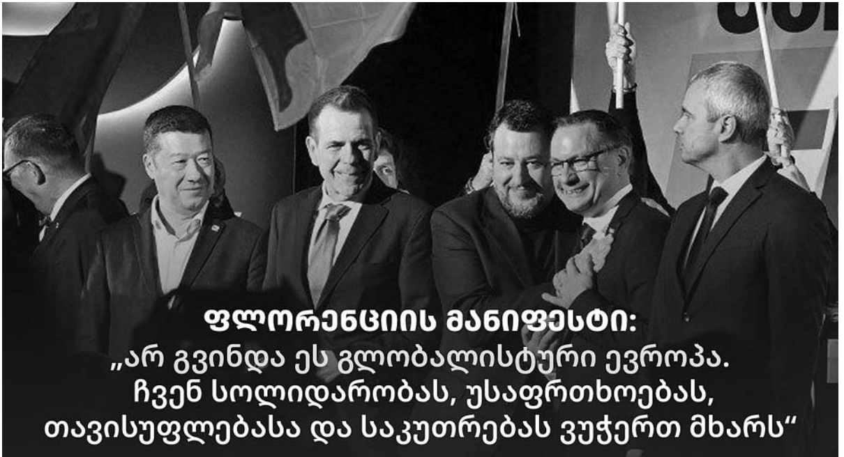
ფლორენსიის მანიფესტი: „არ გვინდა ეს გლობალისტური ევროპა. ჩვენ სოლიდარობას, უსაფრთხოებას, თავისუფლებასა და საკუთრებას ვუჭერთ მხარს“

ახლა, როდესაც საუბარია იმაზე, რომ ევროპის უმაღლესი წარმომადგენლების მხრიდან საქართველოს ევროინტეგრაციის მომავალი, შესაძლოა, ერთობლივ პაკეტში განიხილონ, სერიოზულად მიხედება ეტყვი, რომ იმ ევროპაშიც ვერ არის საქმე დალაგებულად. რანაირად შეიძლება ერთობლივ პაკეტში განიხილო კანდიდატის სტატუსის მქონე და სტატუსის არმქონე ქვეყნები? რა შუაშია უნგრეთის პოზიცია, რომელმაც, შესაძლოა, დაბლოკოს უკრაინის ევროკავშირის წევრობის საკითხი საქართველოსთვის კანდიდატის სტატუსის მინიჭებასთან, საბავშვო ბაღია და ბავშვები თამაშობენ? თუმცა, თუ ამის კადრებზე მიდგა საქმე, თვალნათელია, რომელი ქვეყნები იქნებიან წინააღმდეგი — ლიუტუა, ლატვია და ესტონეთი, რადგან ეს ის ქვეყნებია, რომლებიც მიზეზთა გამო, ზესიმპათიით არიან განწყობილი საქართველოს შიდა მტრების მიმართ.