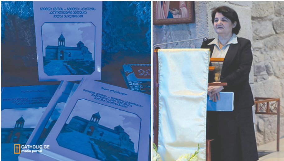
(იბეჭდება შემოკლებით, ვრცლად იხილეთ ვებგვერდზე - „catholc.ge“)