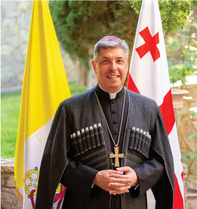
ინტერვიუ ჟოზე აველინო ბეტენკურთან, წმიდა საყდრის სამოციქულო ნუნციუსთან საქართველო-სა და სომხეთში.

მის აღმატებულებას, წმიდა საყდრის დესპანს საქართველოსა და სომხეთის რესპუბლიკაში, არქიეპისკოპოს ჟოზე აველინო ბეტენკურს დიპლომატიური სამსახურის ვადა ამოეწურა, სულ მალე ნუნციუსი დატოვებს საქართველოს და დიპლომატიურ მისიას კამერუნში გააგრძელებს. დასავლეთ აფრიკის ამ 27 მილიონიან სახელმწიფოში მოსახლეობის 27 პროცენტი კათოლიკეა და კათოლიკე ეკლესია ყველაზე მრავალრიცხოვან კონფესიას წარმოადგენს. ასე რომ, მის უმაღლესობას ბევრად მეტი ძალისხმევა დასჭირდება წმიდა საყდრის დიპლომატიური და ეკლესიათმორისი მისიის წარმატებით განსახორციელებლად.