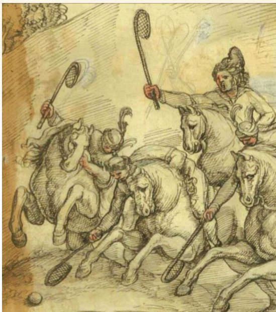
დონ კრისტოფორო დე კასტელი, ქართველები თამაშობენ „პოლოს“. ჩანახატი გაკეთებულია 1640-იან წლებში.

კური სადეკანოს დაფუძნების შემდგომ ბევრად გაადვილდა გურიის კათოლიკეების ოცნების აღსრულება. მამა გაბრიელე ბრაცანტინის უშუალო ძალისხმევით, ქალაქ ოზურგეთშიც და სოფელ შრომაშიც უკვე გასული საუკუნის 90-იანი წლების ბოლოდან სისტემატურად ტარდებოდა წმიდა ნირვები, აღესრულებოდა საეკლესიო რიტუალები, საჭიროების შემთხვევაში, მამა გაბრიელე სტუმრობდა ანასეულსაც. ამგვარად, ჩამოყალიბდა მუდმივი ადგილობრივი სამრევლოები თავიანთი სამრევლო საბჭოებით, რომელთა აქტიური ძალისხმევით გადაიდგა პირველი ნაბიჯები, რათა გურიაში მცხოვრებ კათოლიკეებს ოფიციალურად შეძლებოდათ აეგოთ თავიანთი ტაძრები. გურიის კათოლიკეთა ამ სურვილმა, სამოციქულო ადმინისტრაციის ხელშეწყობით, მალე სასურველი ნაყოფიც გამოიღო და დღეს ოზურგეთის ცენტრში აიგო და მოქმედებს წმ. სტეფანე პირველწამებულის სახელზე ნაკურთხი ტაძარი, ხოლო სოფელ შრომაში - სამლოცველო სახლი.