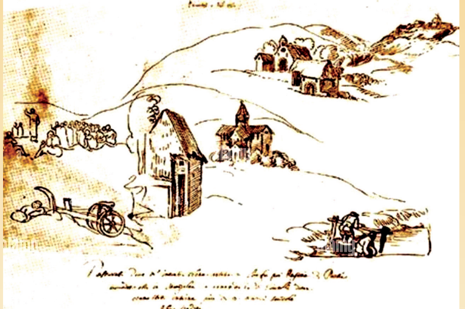
დონ კრისტოფორო დე კასტელი, გურიის სოფლის ჩანახატი

სადაც ჩაის კულტურა აღმავლობას განიცდიდა და მუშახელზე მოთხოვნა გაიზარდა, სამხრეთ საქართველოს, კერძოდ კი, ჯავახეთის სოფლებიდან, სადაც მზარდი მოსახლეობა მცირემინიანობით იყო შეჭირვებული, დაიწყო გეგმიური მიგრაცია. ჯავახეთიდან, განსაკუთრებით კი სოფელ ტურცხიდან, ათეულობით ეთნიკურად სომეხი და აღმსარებლობით კათოლიკე ოჯახი გადმოსახლდა ოზურგეთის (იმხანად მახარაძის) რაიონში. ასე რომ, თავად ოზურგეთში, ანასეულში, შრომაში გაჩნდა კათოლიკეებით კომპაქტურად დასახლებული უბნები. კათოლიკური ტრადიციიდან და რელიგიური კულტურიდან გამომდინარე, გურიაში გადმოსახლებულმა კათოლიკეებმა, მიუხედავად იმისა, რომ საბჭოთა ათეისტური რეჟიმის პირობებში მათ რელიგიურობას, მით უმეტეს, კათოლიკურ აღმსარებლობას განსაკუთრებული დამალვა სჭირდებოდა, ათწლეულების მანძილზე შეინარჩუნეს კათოლიკობისადმი ერთგულება. ამგვარად, ვიდრე პიროვნული