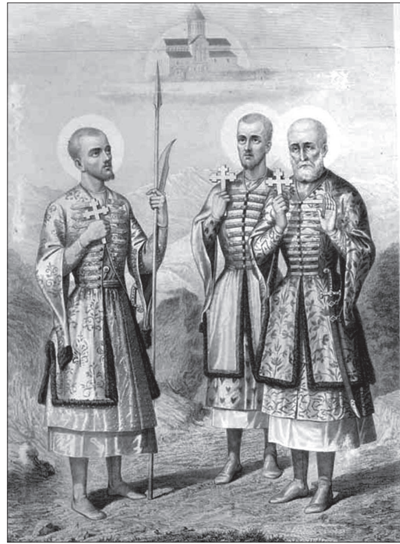
ველის საგარეო პოლიტიკა“; თბ., 1990წ. გვ. 142-145.

ამ ამბების შესახებ ვერაფერი შეიტყო და კახეთში დაბრუნების ნაცვლად იმერეთში გადავიდა? ასევე აუხსენია, ვახტანგ V-მ (შაჰ-ნავაზმა) 1660 წლის მაისამდე რატომ დატოვა დაუფლად ზაალ ერისთავი და აჯანყების სხვა მოთავეები? აღნიშნული თვალსაზრისი მკვლევარმა კიდევ ერთხელ გაიმეორა 1990 წელს თავის მონოგრაფიაში „თეიმურაზ პირ-