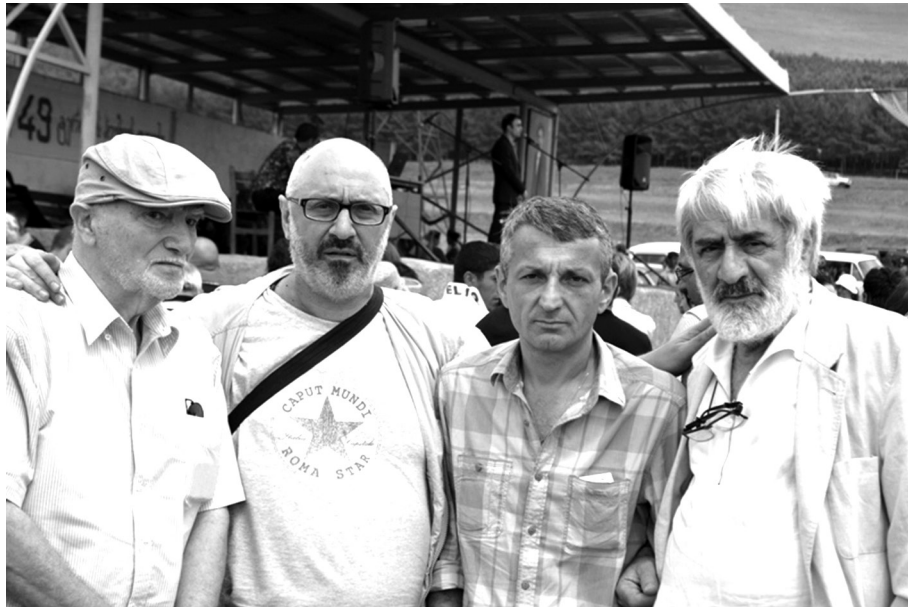
„ო, ნუთუ ბოლო პოეტი მე ვარ?!“ – გულამაჩუყებლად ჟღერს 1913 წელს დაწერილი პოეტის ეს სიტყვები. ალბათ, ვაჰან ტერიანის პოეზიის ყველა თავყვანისმცემ-