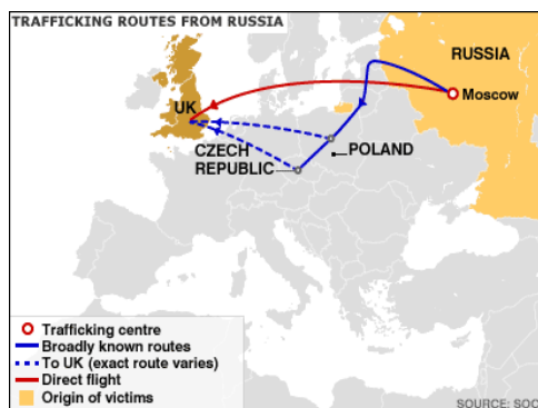
Obrázek č.3: Přeprava obětí z Ruska