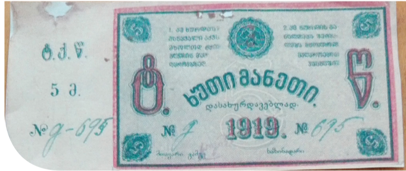
ტყიბულის მხარეთმცოდნეობის მუზეუმის ინფორმაცია