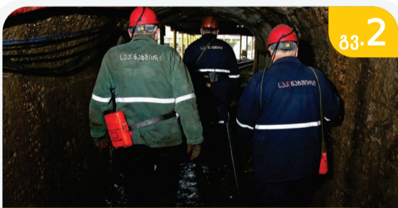
უსაფრთხოების კონტროლი კიდევ უფრო გააძლიერდა!