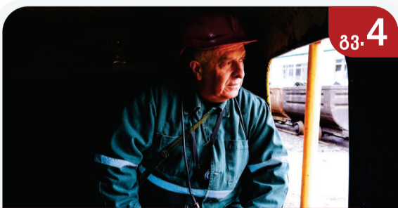
47 წელი შახტაში