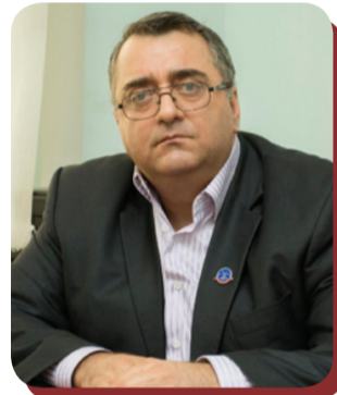
დღემდე, პირველად მოხერხდა, რომ პროფკავშირს, შრომით კოლექტივსა და კომპანიას შორის ურთიერთობები კოლექტიურ პასუხისმგებლობებს დაექვემდებარება.

ხელშეკრულება ძალაში 2021 წლის 1 მაისიდან შევა. მას სტაბილური, ჰარმონიული სამუშაო გარემოს შექმნის თვალსაზრისით დიდი მნიშვნელობა აქვს როგორც დასაქმებულებისთვის, ისე კომპანიისთვის.