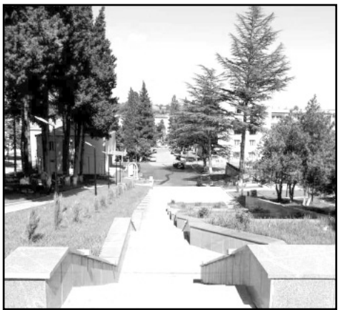
გვერდის ავტორი გზია ცაიფურიშვილი