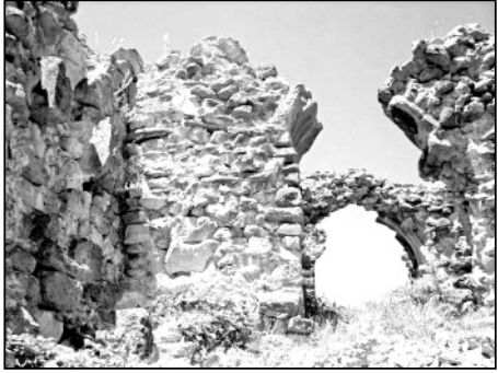
„არს მთის კალთას, სკანდას, სასახლე მეფეთა და ციხე დიდი, დიდშენი“ ვახუშტი ბაგრატიონი