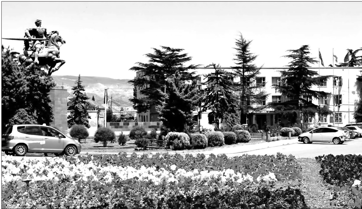
ლურ დოკუმენტებს, ამ დრომდე კასპის მუნიციპალიტეტის ვებ-გვერდზე მხოლოდ 2021-2022 წლის სამოქმედო გეგმა და საბჭოს შემადგენლობა გამოქვეყნებული.

რაც შეეხება გენდერული თანასწორობის საბჭოსთან დაკავშირებულ ოფიცია-