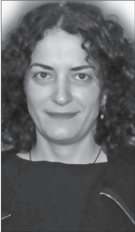
მნიშვნელოვანია, რომ მშობლებს არ დაავიწყდეთ სხვა გასაკეთებელ საქმეებთან ერთად, ბავშვებთან ურთიერთობებიც რომ სასიცოცხლოდ მნიშვნელოვანია.

დედები, რომლებიც არიან ძალიან დაკავებულნი, მათ აქვთ ძალიან დიდი დანაშაულის განცდა, იმის გამო, რომ სათანადო დროს ვერ ატარებენ შვილთან. ამ დროს მნიშვნელოვანია, ურთიერთობისას, რამდენად ჩართულები არიან ბავშვთან ერთად თუნდაც თამაშში ემოციურად და ა.შ. უნდა ეკითხებოდნენ ბავშვს, როგორ გაატარეს დრო, მნიშვნელოვანია არა მხოლოდ ფიზიკურად ერთად გაატარებული დრო, არამედ მთავრია რა ხარისხის ჩართულობა აქვს დედას ბავშვთან მიმართებაში. ასევე, ვურჩევდი მშობლებს საკუთარი დანაშაულის გრძობაზეც იმუშაონ, რადგან ძალიან მაგრები არიან. ამდენ რამეს, რომ აგვარებენ, ზრუნავენ სახლზე, შვილებზე, მოკლედ შეაქონ უფრო მეტად საკუთარი თავი.