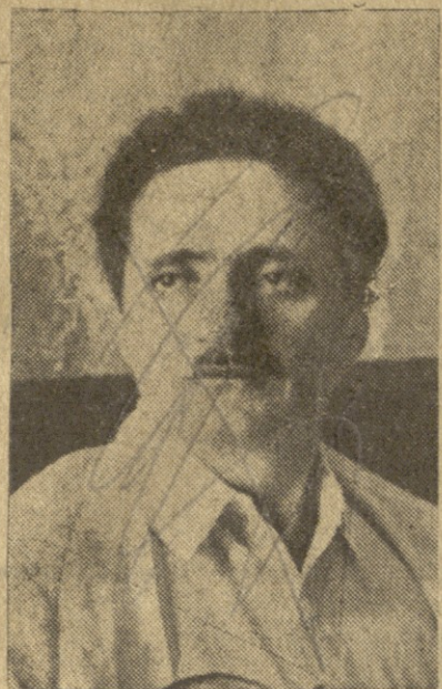
Пред. ЦИК'а АССР Абхазии тов. Н. ЛАКОБА.