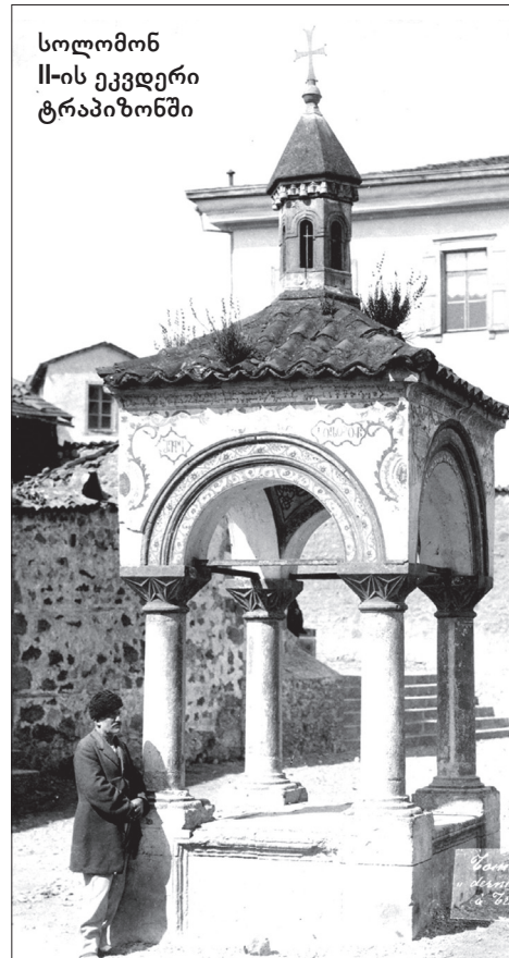
სოლომონ II-ის ეკვდერი ტრაპიზონში

საპოლიციო-ადმინისტრაციული მოხელეებიდან ერთ-ერთი პირველი ადგილი ბოქაულთუხუცესს ეჭირა. მე-18-მე-19 საუკუნეთა მიჯნაზე, ამ თანამდებობაზე წერეთლები იყვნენ. მნიშვნელოვანი იყო, აგრეთვე, ხევისთავის „სახელო“. მის მოვალეობას დამნაშავეთა დევნა-აღმოჩენა შეადგენდა.