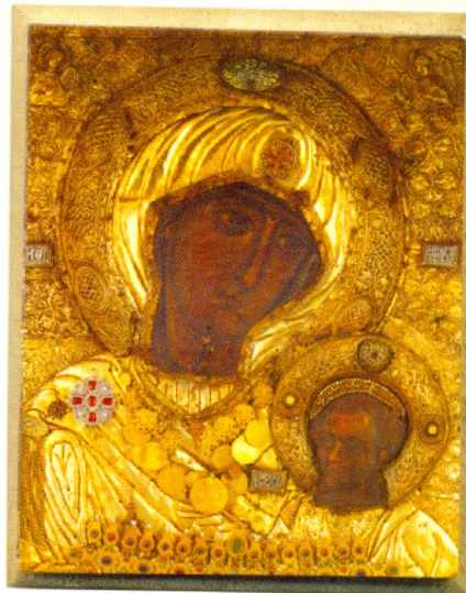
მხარის ღვთისმშობლის ხატი

999 წელს აღდგომის დღესასწაულზე ათონის მთაზე, ივერონად წოდებულ ქართულ მონასტერში, ზღვის ცალღებზე აღმართული მიზნაძანდა ივერიის ყოვლადწმიდა ღვთისმშობლის სასწაულთმოქმედი ხატი. ზღვიდან მისი გამობრძანების პაცივი ქართველ ბერთა შორის სიწმინდით გამორჩეულ მამა გაბრიელს ხედა წილადა. იმ ადგილას, სადაც წმინდა გაბრიელმა ხატი გამოასვენა, საკვირველთმოქმედმა წყარომ ამოხეთქა, რომელიც დღემდე მოედინება და ყოველგვარ სულიერ და ხორციელ სნეულებათა მკურნალია.